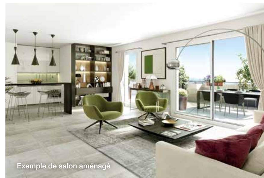
Exemple de salon aménagé