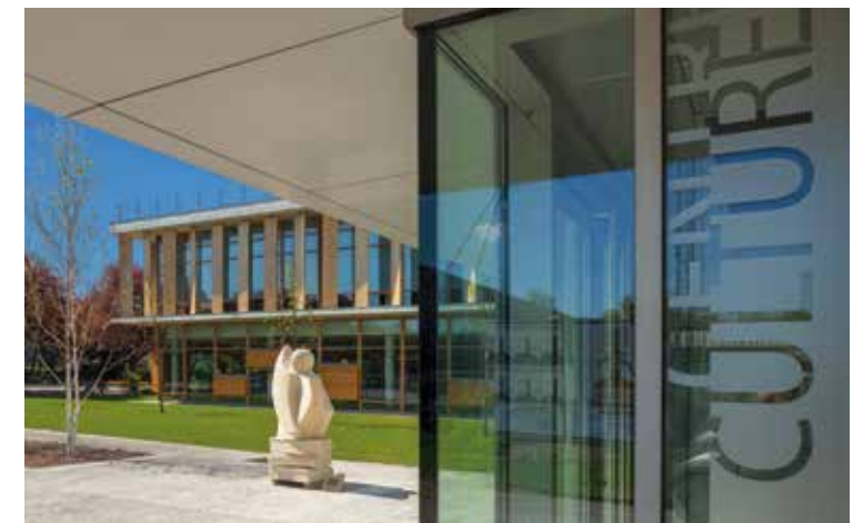
Centre culturel Joseph Kessel