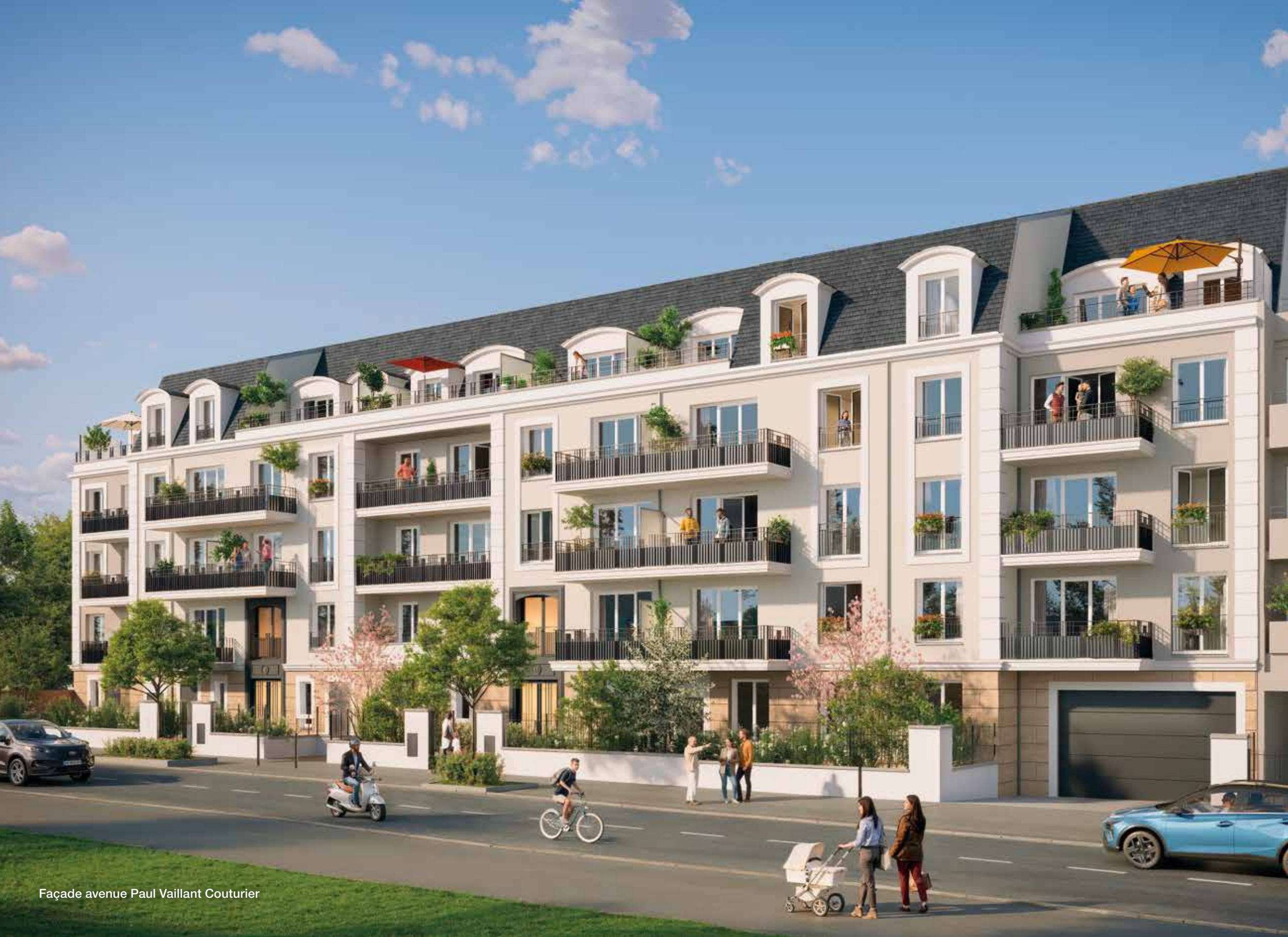
Façade avenue Paul Vaillant Couturier