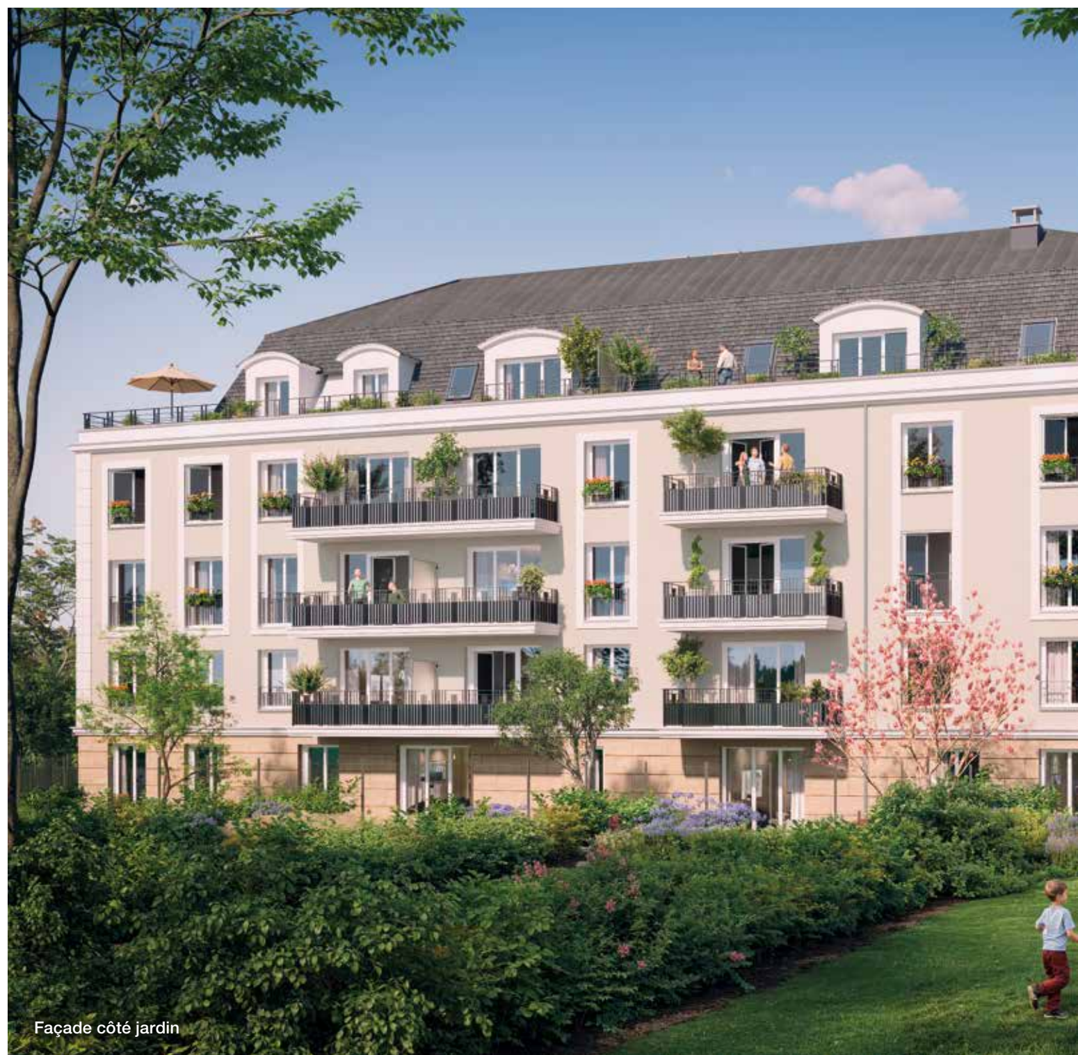
Façade côté jardin

L'ensemble compose ainsi une architecture équilibrée, pensée pour traverser le temps et offrir un cadre de vie harmonieux à ses habitants.